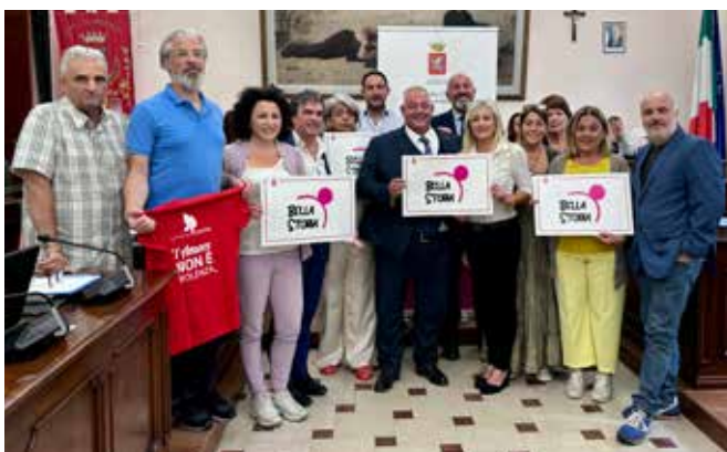
Olympia De Gouges e Tutto è vita