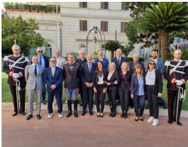
Amministratori in visita ai Corazzieri

È stato possibile conoscere la storia della Guardia d'onore del presidente della Repubblica e ammirare stanze e attività dei Corazzieri, le scuderie, il salone delle moto d'epoca e tutti i simboli della loro storia. Un'iniziativa pensata per valorizzare l'assemblea consiliare, in maniera congiunta, con un'attività diversa da quelle tradizionali.