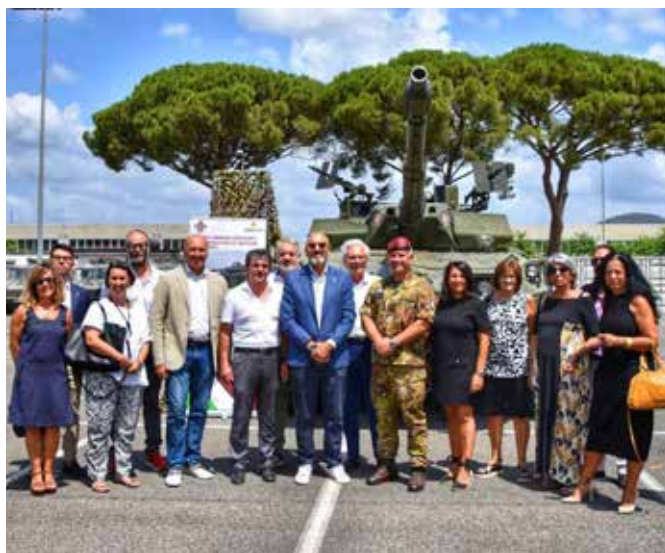
Accoglienza al reggimento Savoia Cavalleria

La caserma Beraudo di Pralormo ha accolto l'Amministrazione comunale in visita al museo del reggimento Savoia Cavalleria.