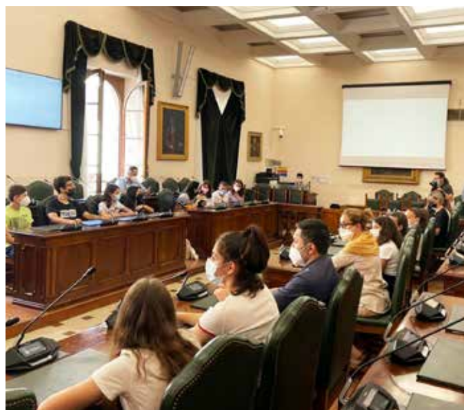
Cerimonia conclusiva del progetto