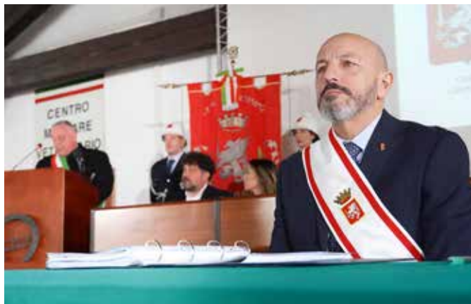
Un momento del Consiglio comunale al Cemivet

Il 3 febbraio 2023 per la prima volta è stato convocato un Consiglio comunale straordinario al Centro militare veterinario (Cemivet): un progetto condiviso e sostenuto da tutti i capigruppo consiliari, che hanno così dimostrato vicinanza a questa istituzione, e accolto con grande disponibilità prima dal comandante Mario Piero Marchisio e poi dal comandante Salvatore Santone, oltre che dal prefetto. È stata un'occasione per valorizzare il patrimonio storico e culturale del centro