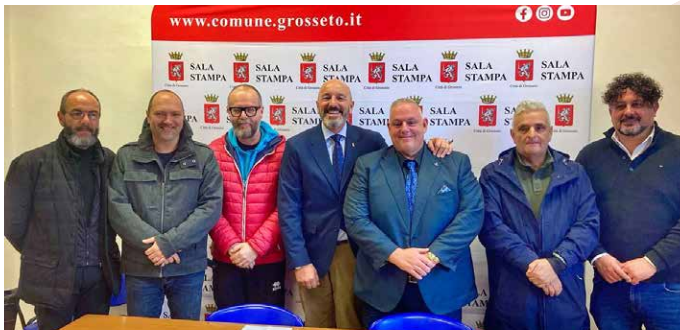
Inaugurazione della sala stampa Mancini

Per la prima volta, all'inizio del 2024, il Comune di Grosseto si è dotato di una sala stampa a disposizione di sindaco, assessori e consiglieri per la comunicazione istituzionale. Uno spazio ad hoc dedicato alle notizie destinate ai cittadini, facilmente riconoscibile grazie al pannello con l'immagine stilizzata del Municipio e lo stemma della città che fa da sfondo a conferenze stampa e interviste. La sala è stata intitolata al giornalista Mauro Mancini (ex firma de La Nazione di Grosseto), che perse la vita nel 1978 in un naufragio con Ambrogio Fogar a 200 miglia dalle isole Falkland.