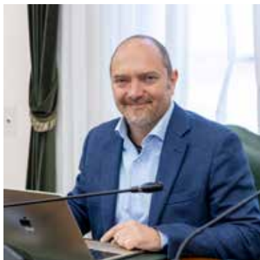
Giacomo Gori Movimento 5 stelle (capogruppo)