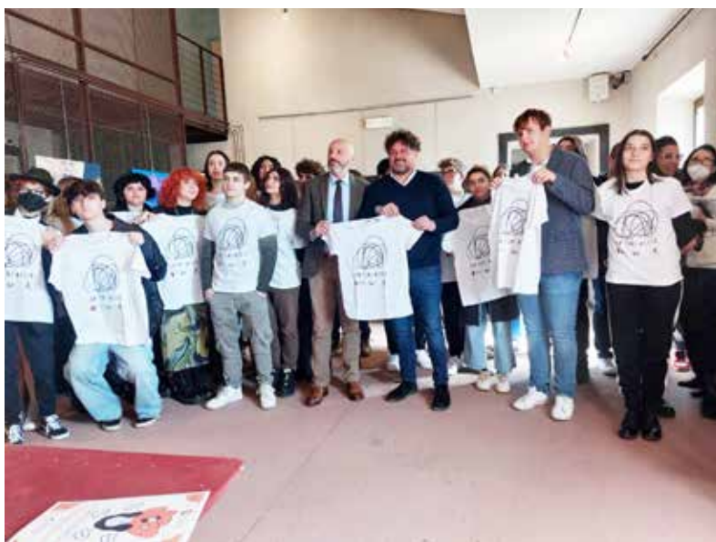
Con ogni mezzo in sala del Consiglio e al Cassero