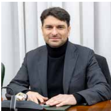
Giacomo Cerboni Lega Salvini Premier (capogruppo)