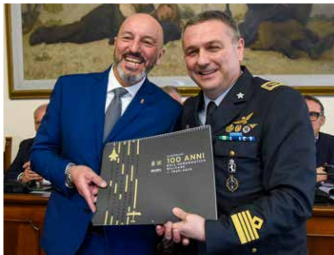
Presentazione del centenario dell'Aeronautica militare