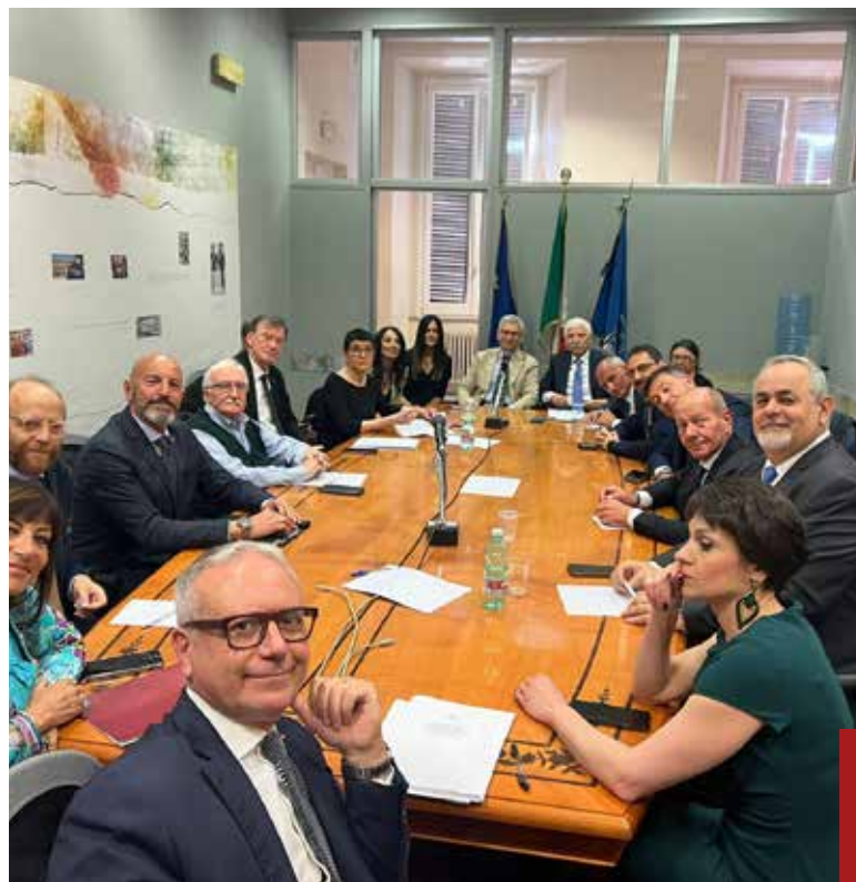
Foto di gruppo durante una riunione a Roma