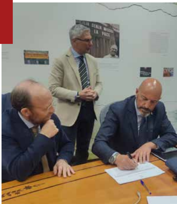
Firma della nota congiunta sui gettoni di presenza