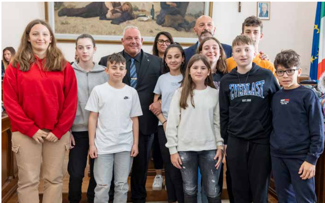
Tributo a don Milani e alla Toscana dei valori

2023 - “Don Milani, la Toscana dei valori”: gli studenti hanno realizzato lavori di gruppo per promuovere il tema del “mi importa, mi interessa”. Per la cerimonia di premiazione nella sala del Consiglio comunale sono stati scelti tre elaborati vincitori a pari merito, ma tutti i testi saranno presto raccolti in un e-book che verrà pubblicato sul sito internet del Comune di Grosseto. La dedica a don Milani, a cento anni dalla sua nascita, punta a riaffermare i suoi insegnamenti, tuttora rilevanti e attuali.