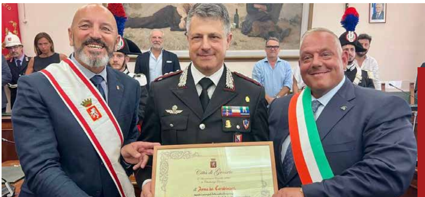
Cittadinanza onoraria all'Arma dei Carabinieri