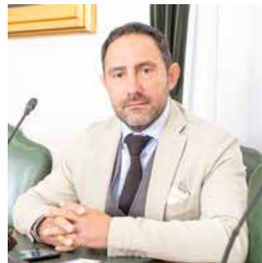
Gino Tornusciolo Lega Salvini Premier