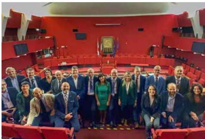
Riunione del coordinamento a Genova

Nell'ottobre 2023, in occasione della quarantesima assemblea annuale dell'Anci (Associazione nazionale Comuni italiani) che si è svolta a Genova, è iniziato il percorso per la creazione di un coordinamento dei presidenti dei Consigli comunali italiani.