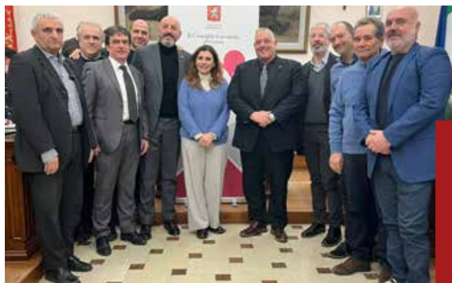
Donazione di sangue