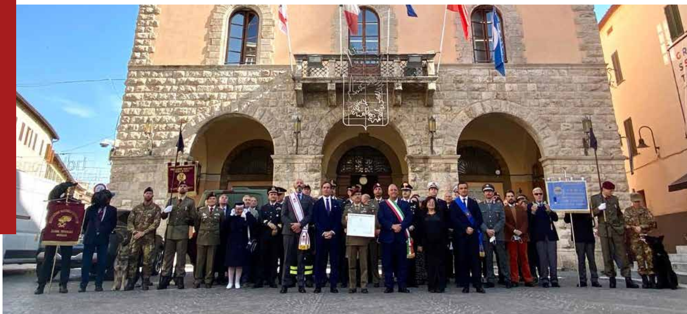
Cittadinanza onoraria al Milite ignoto