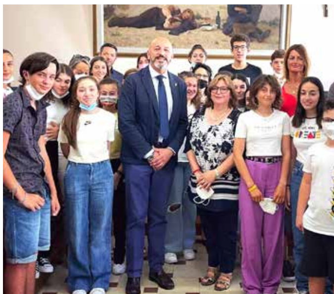
I giovani che educano i giovani

2021 - “I giovani che educano i giovani” contro il cyberbullismo: ha coinvolto i ragazzi delle scuole medie nella realizzazione di un video di pochi minuti per sensibilizzare i coetanei all’utilizzo di un linguaggio ispirato alla correttezza e al rispetto reciproco. Gli studenti hanno risposto con grande entusiasmo all’iniziativa e, tra i numerosi contributi ricevuti, ne sono stati selezionati alcuni che sono stati inseriti in un filmato che raccoglie le immagini e i messaggi più significativi e originali. Il video è poi stato pubblicato e diffuso attraverso i mezzi di comunicazione e i profili social del Comune di Grosseto.