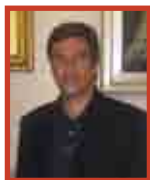
Il Sindaco Emilio Bonifazi